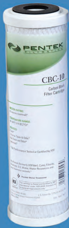
CBC-10 Carbon Block 0,5 micron