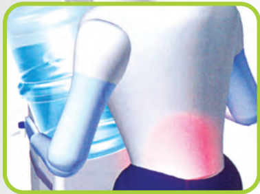
ΤΟΠΟΘΕΤΗΣΗ ΤΗΣ ΜΠΟΥΚΑΛΑΣ