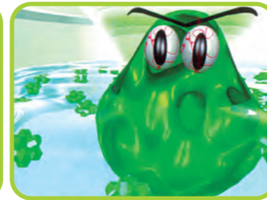
ΜΟΛΥΝΣΗ ΑΠΟ ΒΑΚΤΗΡΙΔΙΑ