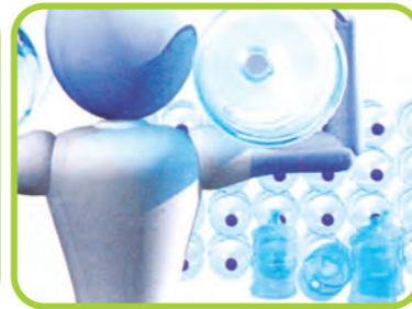
ΑΠΟΘΗΚΕΥΣΗ ΤΩΝ ΜΠΟΥΚΑΛΩΝ