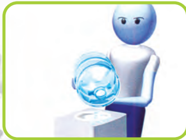
ΔΙΑΡΡΕΣ ΚΑΤΑ ΤΗΝ ΤΟΠΟΘΕΤΗΣΗ